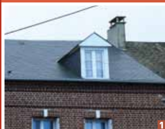
Toiture à deux pans