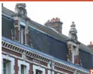
Toiture à la mansart